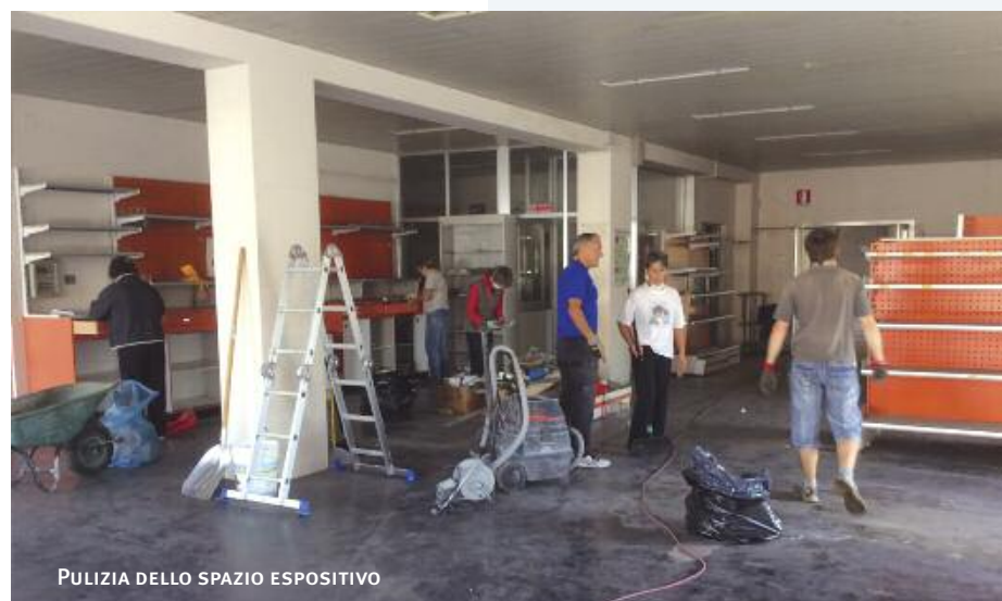
PULIZIA DELLO SPAZIO ESPOSITIVO