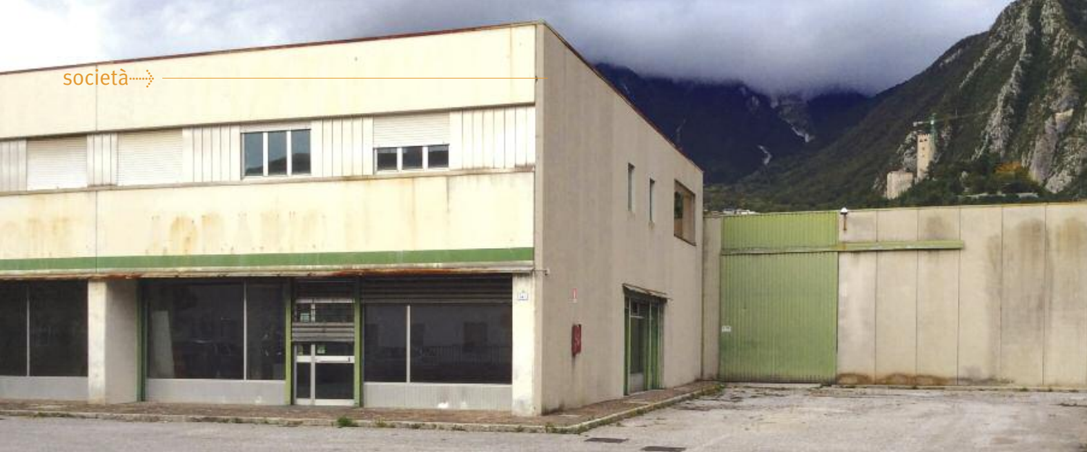
LA SEDE DEL CENTRO, IN VIA SANTA LUCIA